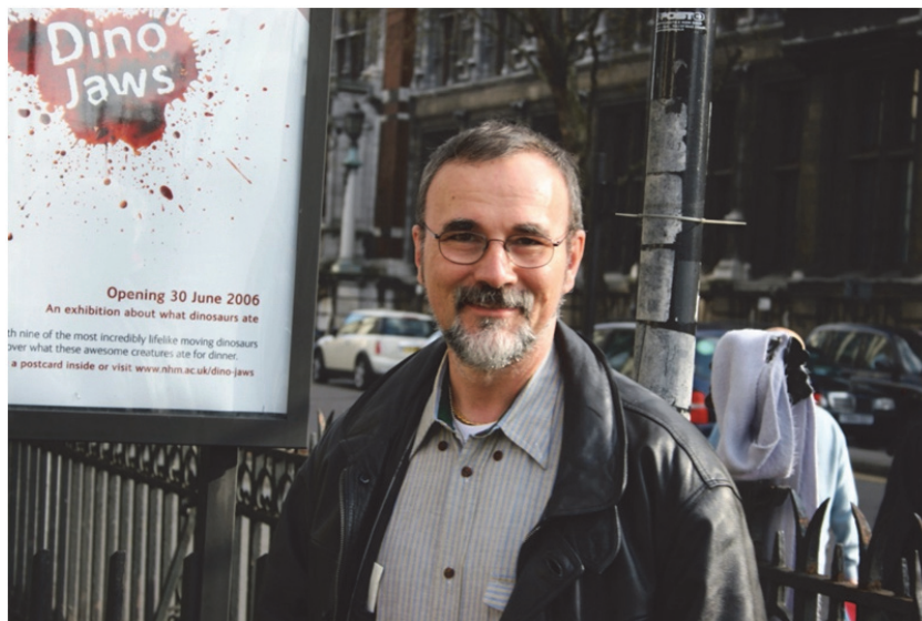
Figura 1. Estancia en el Museo de Historia Natural de Londres (abril 2006) para revisar material tipo de especies de Holothuriidae and Stichopodidae.

A lo largo de su larga carrera, Claude realizó 55 expediciones y visitas a instituciones diversas (Figuras 1, 2) (véase Samyn 2021). Sobre la base de estas actividades, consiguió abundantes datos y material que fueron su tema de estudio durante sus años como investigador en el KBIN-IRSNB. Destacan en particular sus expediciones en Laing Island, Papua New Guinea (8 expediciones), en Rapa Nui (isla de Pascua), Madagascar, La Réunion y las Comoras (Figura 3). Todas estas expediciones permitieron a Claude reunir amplias colecciones de organismos marinos, con un enfoque particular sobre su grupo favorito: las holoturias. La enorme mayoría de este material fue tema de cuidadosos estudios que dieron origen a una colección de más de 10,000 preparaciones de osículos de diversas especies de holoturias para microscopía. La calidad de las ilustraciones incluidas en sus trabajos siempre reflejó su afición por proporcionar dibujos precisos (Figura 4).