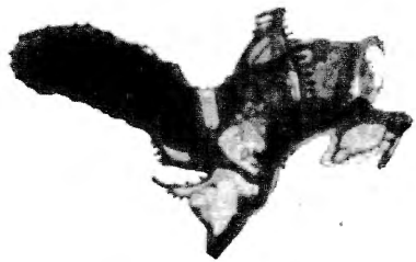
Fig. 7. — Une corbule normale sur le pédoncule d'une corbule à côtes libres.