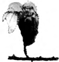
Fig. 3. — Une corbule à côtes libres.