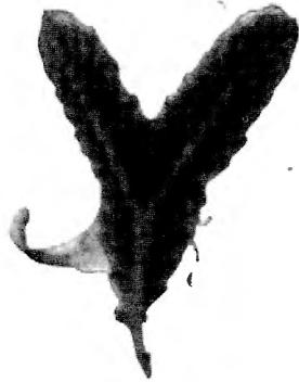
Fig. 5. — Une corbule bifurquée vers le milieu du rachis.