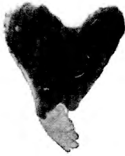
Fig. 2. — Deux corbules soudées par leurs premières paires de côtes.