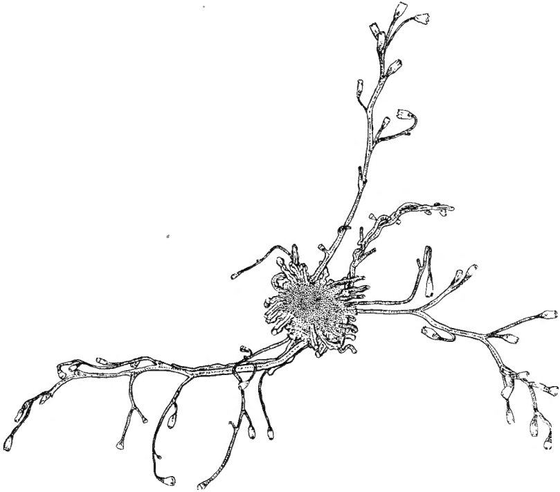
Obelia spinulosa (Bale).

Trois hydrocaules principaux de 5 mm. de longueur s'en détachent. En plus, il existe quelques hydrocaules plus petits qui ne portent qu'un petit nombre d'hydranthes.