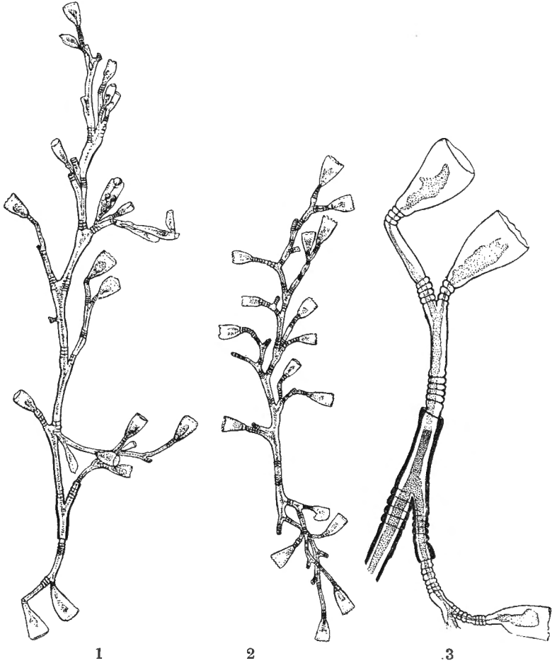
Obelia longissima (Pallas).