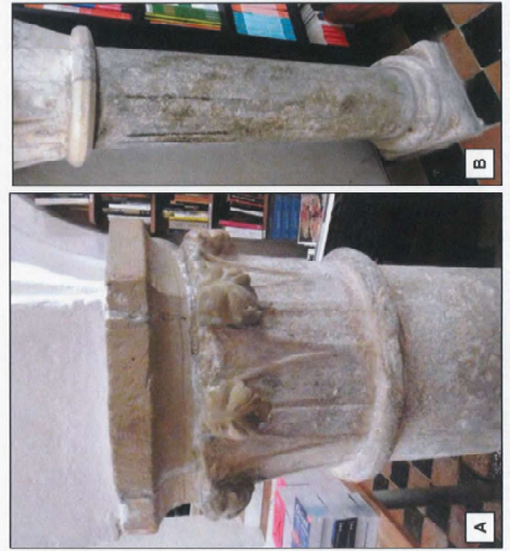
Abb. 1: A – Kapitell auf aus oolithischem Baumberger Kalkstein; B – Säule aus magmatischem Gestein.