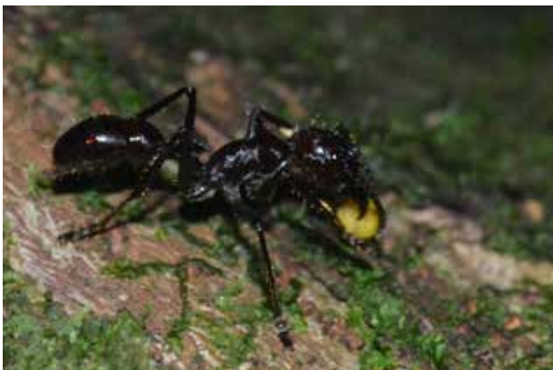
Figura 21.5. Obrera de Paraponera clavata forrajeando de noche en el Parque Nacional Yasuní, Ecuador.

(Dyer, 1997). El peso promedio ( \pm DS) de la presa que es cargada por una obrera es de 23.8 \pm 10 mg (Fewell et al. , 1996). Se calculó que la biomasa mínima de P. clavata en un bosque tropical es de 266 gramos por hectárea (Tillberg y Breed, 2004). En comparación, la biomasa de Eciton burchellii (Westwood 1842), un depredador clave en los ecosistemas neotropicales, es de 480 g/ha. Además, se estima que P. clavata consume entre 57 y 402 gramos de presas por hectárea y por día (Dyer, 2002). Así, por ser un depredador abundante y eficiente, P. clavata juega un papel ecológico importante, particularmente en la protección de las plantas contra la herbivoría y en el control de las poblaciones de artrópodos (Wetterer, 1994; Dyer, 2002; Tillberg y Breed, 2004). Así mismo, P. clavata es considerada una especie dominante o co-dominante en los mosaicos de hormigas arborícolas (Dejean et al. , 2003, 2007).