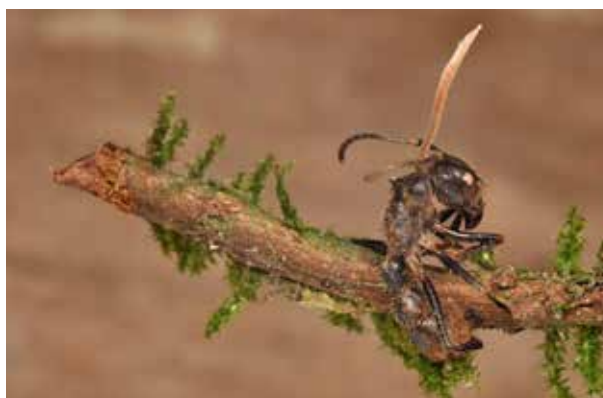
Figura 21.6. Paraponera clavata víctima del hongo entomopatógeno Ophiocordyceps cf. kniphofioides (Otoyaku, Ecuador; determinación del hongo: Václav Kautman; Foto: Milan Kozánec).

Varios insectos mimetizan a P. clavata aprovechando de manera indirecta la abundancia y agresividad de esta hormiga. Es el caso del cerambícido Acyphoderes sexuales , el cual tiene la apariencia e imita el comportamiento de P. clavata cuando camina sobre las ramas. Cuando es capturado, estridula como la hormiga y simula agujonear (Silberglied y Aiello, 1976; Janzen y Carroll, 1991).