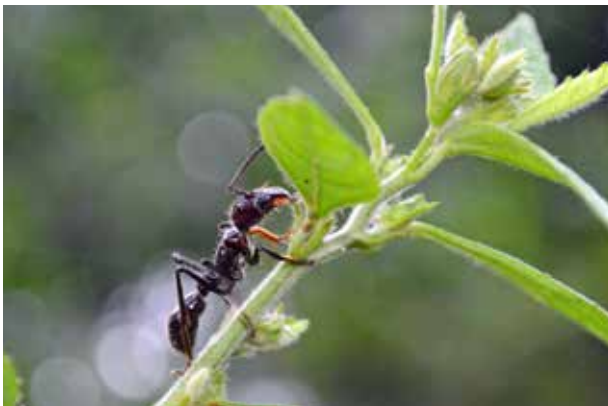
Figura 21.4. Obrera de Paraponera clavata forrajeando de día en el Parque Nacional Yasuní, Ecuador. La especie se encuentra normalmente sobre ramas de diámetro superior a 2.7 mm (Yanoviak et al. , 2012).

En cuanto a las presas capturadas, éstas son diversas y pertenecen a diferentes gremios (Tillberg y Breed, 2004). La mayoría son artrópodos, principalmente himenópteros adultos y orugas de lepidópteros (Dyer, 2002; Tillberg y Breed, 2004), aunque también pueden recolectar invertebrados (como caracoles) y pequeños vertebrados (como ranas) (Young y Hermann, 1980; Fritz et al. , 1981). La hormiga cortadora de hojas Atta cephalotes (Linnaeus 1758) representa ocasionalmente una parte significativa de las presas (Wetterer, 1994; Dyer, 2002). Paraponera clavata caza de manera oportunista y con baja selectividad (Dyer y Floyd, 1993; Dyer, 1995, 1997, 2002). Por ejemplo, de 70 especies de orugas de lepidópteros ofrecidas a diferentes colonias de P. clavata , solamente cerca del 16 % fueron totalmente rechazadas, principalmente aquellas que poseían compuestos químicos de defensa (Dyer, 1995, 1997). Además, gracias a la cooperación entre obreras, P. clavata puede cazar presas con un peso de hasta diez veces mayor que el peso de una sola obrera [una obrera pesa entre 100 y 250 mg (Fewell et al. , 1996)] (Dyer, 1995, 2002). Esta hormiga tiene así un espectro de presas mucho más amplio que otros insectos depredadores