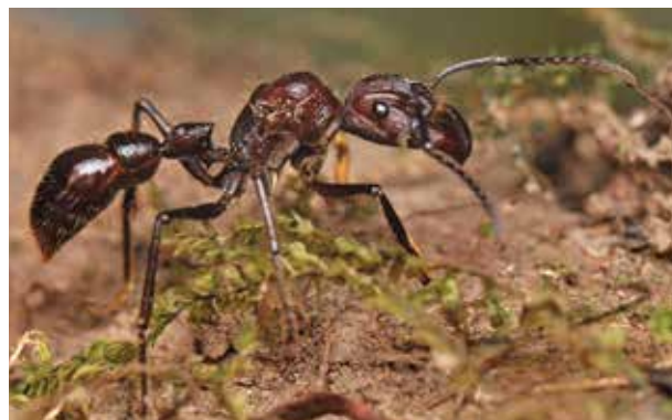
Figura 21.1. Reina de Paraponera clavata recién fertilizada en búsqueda de un lugar donde establecer su nido en el Parque Nacional Yasuní, Ecuador. El surco antenal en forma de 'V', el tercer segmento abdominal (postpeciolo) reducido y el peciolo de forma característica con un pedúnculo largo son bien visibles. (Foto: Milan Kozánec).

Los caracteres diagnósticos (apomorfias) de la subfamilia son: presencia de surcos antenales bien evidentes, los cuales alcanzan la base de la carena frontal y se encorvan por encima de los ojos formando una V sobre la cabeza (figura 21.1), tercer segmento abdominal (postpeciolo) reducido y deprimido (presencia de un cinto), peciolo con un pedúnculo largo, con fusión tergoesternal completa