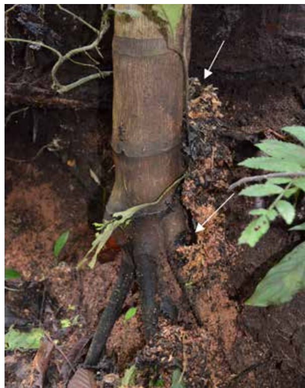
Figura 21.3. Nido de Paraponera clavata establecido a la base de una palma con raíces fúlcreas en el Parque Nacional Yasuní, Ecuador. Túneles de tierra y materiales vegetales se apoyan contra el tronco realizando las dos entradas visibles (flechas). Varias obreras están sobre el tronco..

El nido se extiende dentro de un volumen que alcanza un metro cúbico (Fernández, 1993). En la superficie, el área ocupada por el nido mide 6280 cm 2 en promedio (Elahi, 2005). La temperatura dentro del nido es similar a la del suelo adyacente. Por el contrario, la humedad es significativamente inferior y el pH es superior (Elahi, 2005). Janzen y Carroll (1991), describen la estructura de dos nidos excavados en agosto de 1969 en La Selva, Costa Rica: “Unos túneles de 2 ó 3 cm de diámetro y de paredes lisas se dirigían desde la entrada principal hacia abajo y hacia afuera hasta las cámaras. El nido número 1 tenía treinta y tres cámaras (la más profunda a 35 cm) y el nido 2 cuarenta y tres (la más profunda a 62 cm). Las cámaras más superficiales estaban entre 7 y 10 cm por debajo de la superficie. Una cámara representativa a 7 cm de