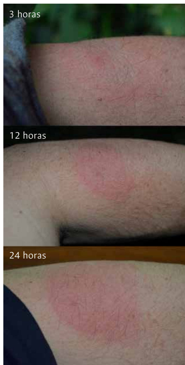
Figura 21.7. Reacción inflamatoria de 3, 12 y 24 horas después de una picadura de Paraponera clavata ..

No es de extrañar los muchos nombres vernáculos que ha recibido P. clavata , los cuales a menudo se refieren al dolor que produce la picadura. Entre los nombres comunes se destacan: chacha , folofa en Panamá; insulla , calentura , perro negro , jaula , tocandira en Perú; bala en Costa Rica; conga , yanave , veinticuatro horas en Colombia y Ecuador; tapiat , tocandeira , vinte-e-quatro , formiga de febre , formiga de quatro picadas en Brasil (Baroni Urbani, 1994; Césard, 2005a; Arias-Penna, 2008).