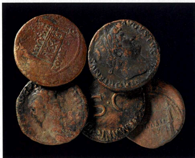
Fig. 11. iactatio stipis : des monnaies confiées à la rivière, dans une gestuelle religieuse....

Enfin, la dernière intervention réalisée en bord de Meuse, quoique de courte durée, a suffi à suivre le tracé de ce même rempart Ad Aquam , là où il amorce une large courbe en direction du confluent. La muraille et ses terrées du XVI e siècle