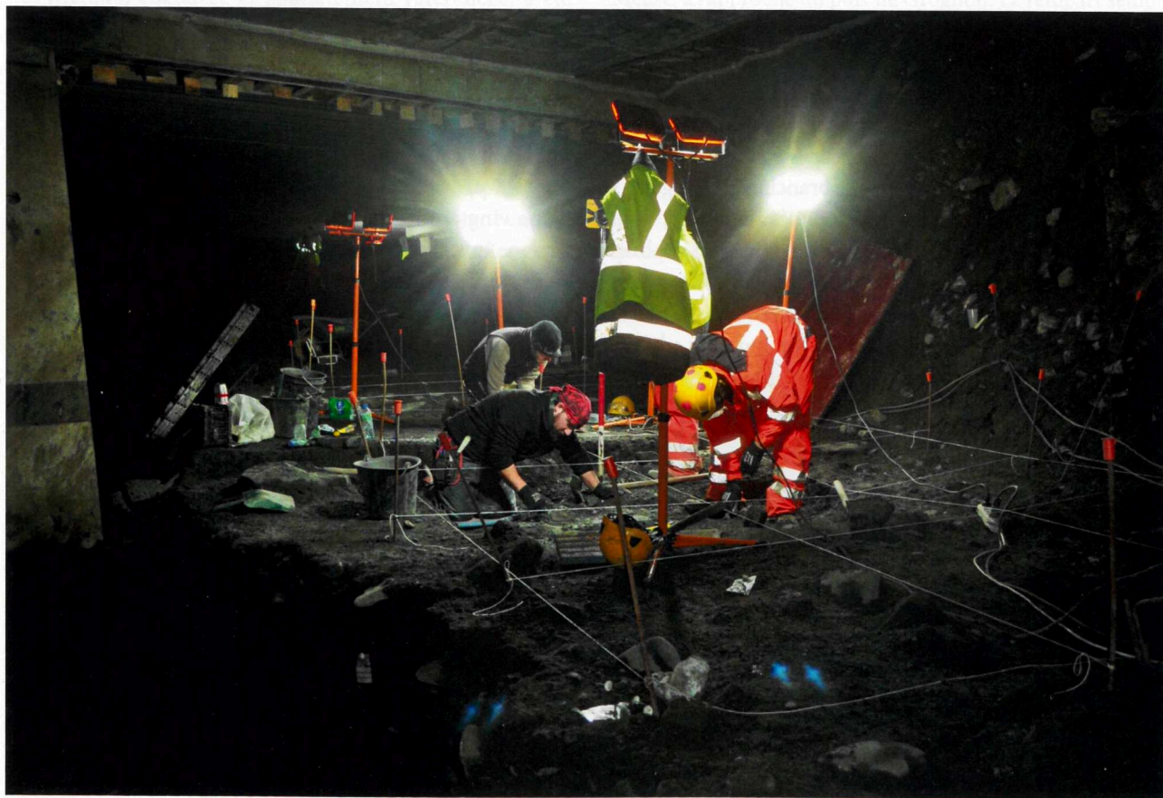
Fig. 9. Niveaux préhistoriques et gallo-romains, sur les plages du confluent Sambre-et-Meuse : une intervention sous la dalle du parking du Grognon en construction.

Dès la phase de suivi, sous la dalle du parking, il est apparu que les niveaux préhistoriques identifiés recelaient des