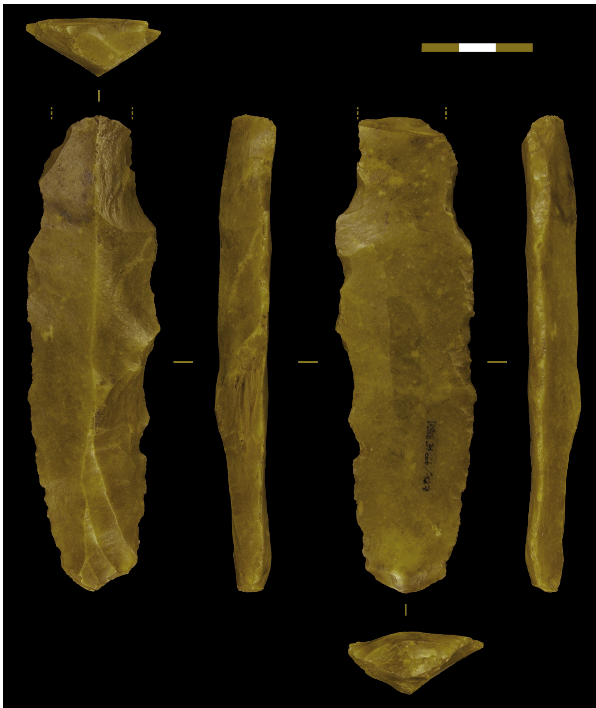
Fig. 4 – Malmedy, « Pouhon de Bernister », lame travaillée du Grand-Pressigny.

va de même pour une autre lame en silex tertiaire découverte en 1953 à Cornesse dans les alluvions à charge caillouteuse de la rive droite de la Vesdre (Cornet & Straet, 1959, 1960). En Allemagne, un poignard complet en Grand-Pressigny a été découvert dans un marais à Aurich (Zylmann, 1933, in : Delcourt-Vlaeminck, 1998 : t. 2, 363-364).