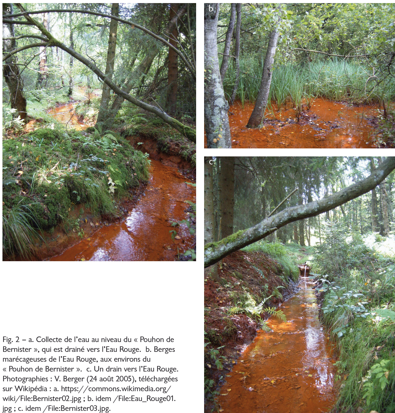
Fig. 2 – a. Collecte de l'eau au niveau du « Pouhon de Bernister », qui est drainé vers l'Eau Rouge. b. Berges marécageuses de l'Eau Rouge, aux environs du « Pouhon de Bernister ». c. Un drain vers l'Eau Rouge.

1976), et entre H64 et J42 selon le code Expolaire (Cailleux & Taylor, 1951). Le matériau est sans grand doute le silex turonien supérieur dit « du Grand-Pressigny ».